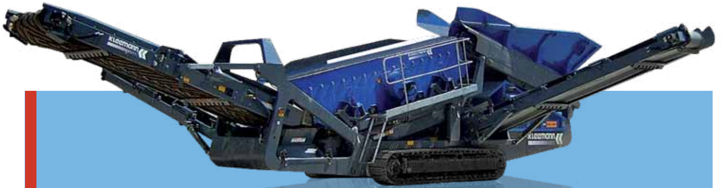
Vue de côté MS 15 Z position de transport